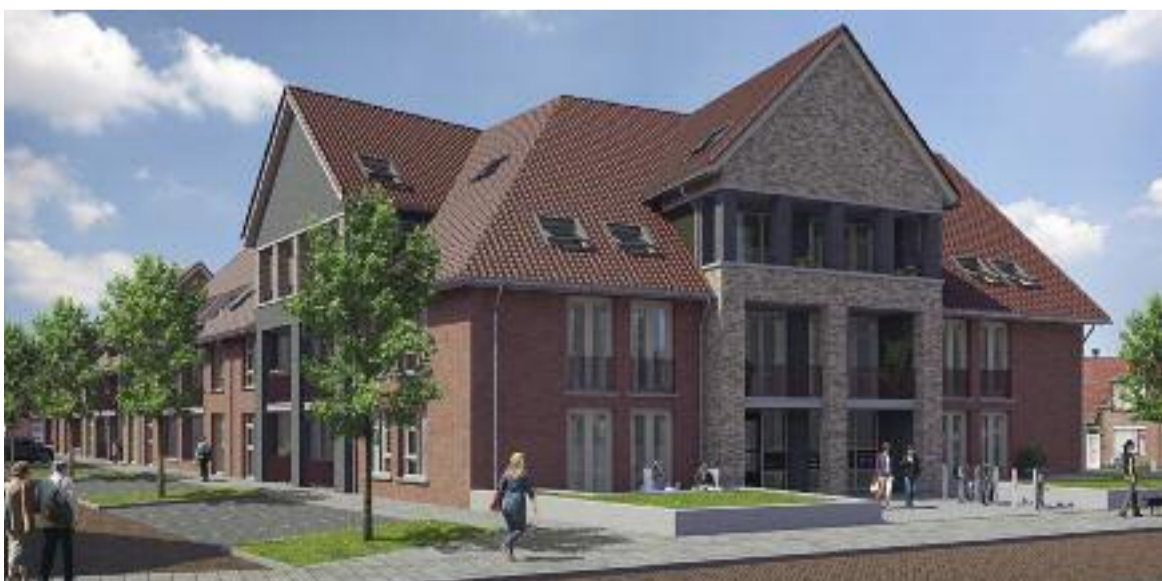
De toekomstige locatie van TaDaiMah.