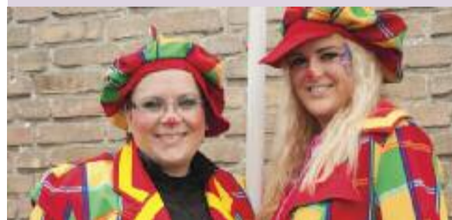
Volop vertier bij opening Dorpshart.