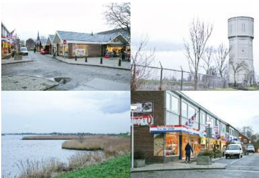
De gemeente Molenwaard in beeld.

Sinds 2009 kunt u als inwoner van een van de drie gemeenten terecht bij het gezamenlijke, maar ook tijdelijke gemeentekantoor in Bleskensgraaf. Dit kantoor met een Klantcontactcentrum, waar u tijdens werkdagen in de ochtend en op donderdagavond met vragen terecht kunt, verdwijnt vanaf medio 2014. Vanaf dan werkt Molenwaard zonder traditioneel gemeentehuis. Er is bewust gekozen om geen nieuw gemeentehuis te bouwen. Ambtenaren en bestuurders beschikken allemaal over een mobiele telefoon en internet en zijn zo goed bereikbaar.