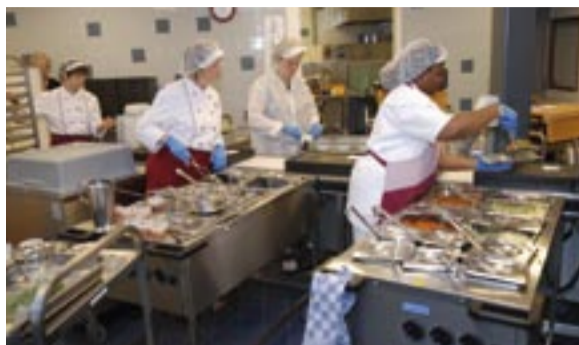
De maaltijden worden bereid in Graafzicht.

De honderd klanten van de Stichting Vrijwillige Hulpdienst Graafstreek ontvangen voor € 5,25 (€ 10,- bij dubbele afname) per dag een goede en gezonde warme maaltijd. "Dat is belangrijk," zegt Abbring. "Als het koken niet meer zo gaat, gaan mensen aan de gang met soep en brood. Maar dat levert op den duur lichamelijke klachten