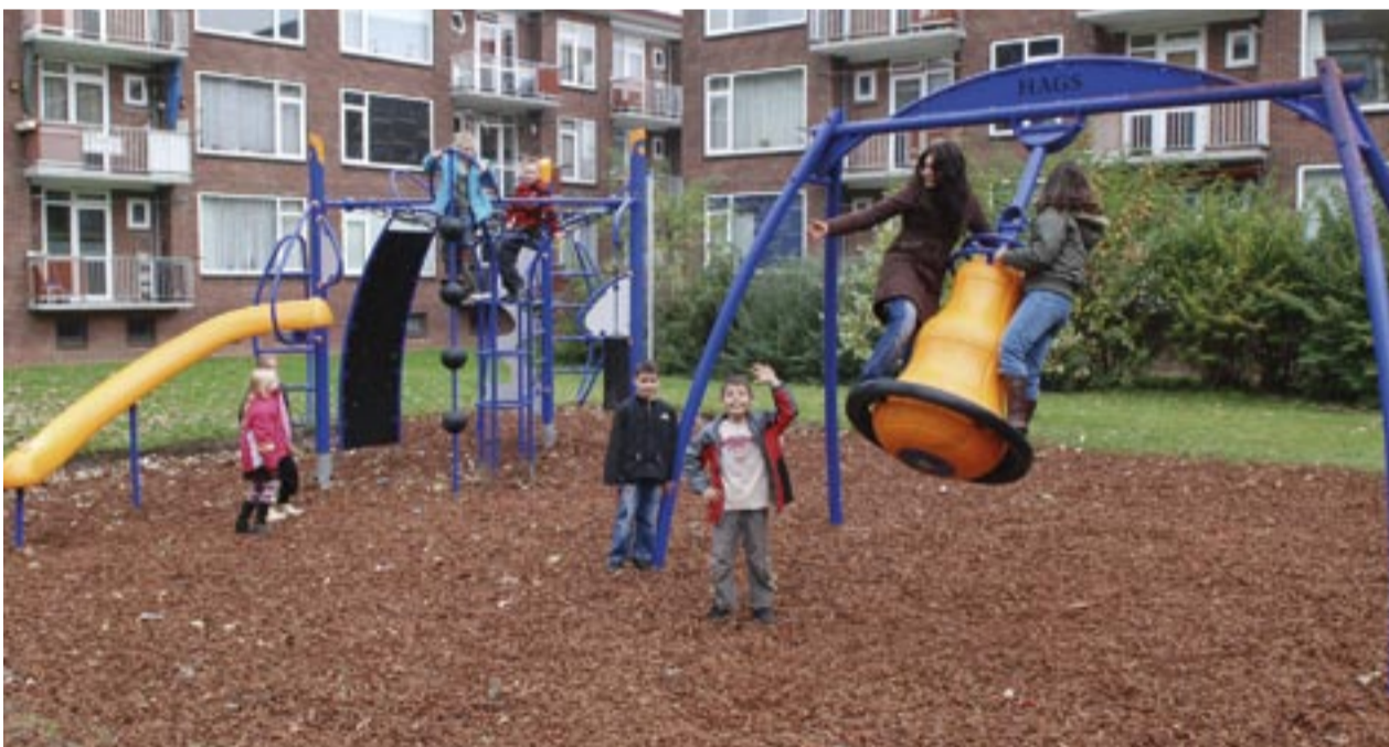
De nieuwe speelplek aan de Rembrandtlaan.

Sliedrecht is sinds kort enkele speelplekken rijker. Het gaat om twee speelplekken aan de Deltalaan en één aan de Rembrandtlaan. De realisering is het resultaat van samenwerking tussen de gemeente Sliedrecht en Tablis Wonen.