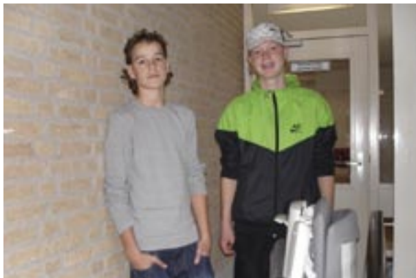
Twee van de vijf liftboys.

in het noodtrappenhuis. Tablis Wonen zorgde dat die er kwam en het Griendencollege stelde vijf liftboys beschikbaar om de bewoners te helpen bij het bedienen van de lift en bij het dragen van bijvoorbeeld boodschappen.