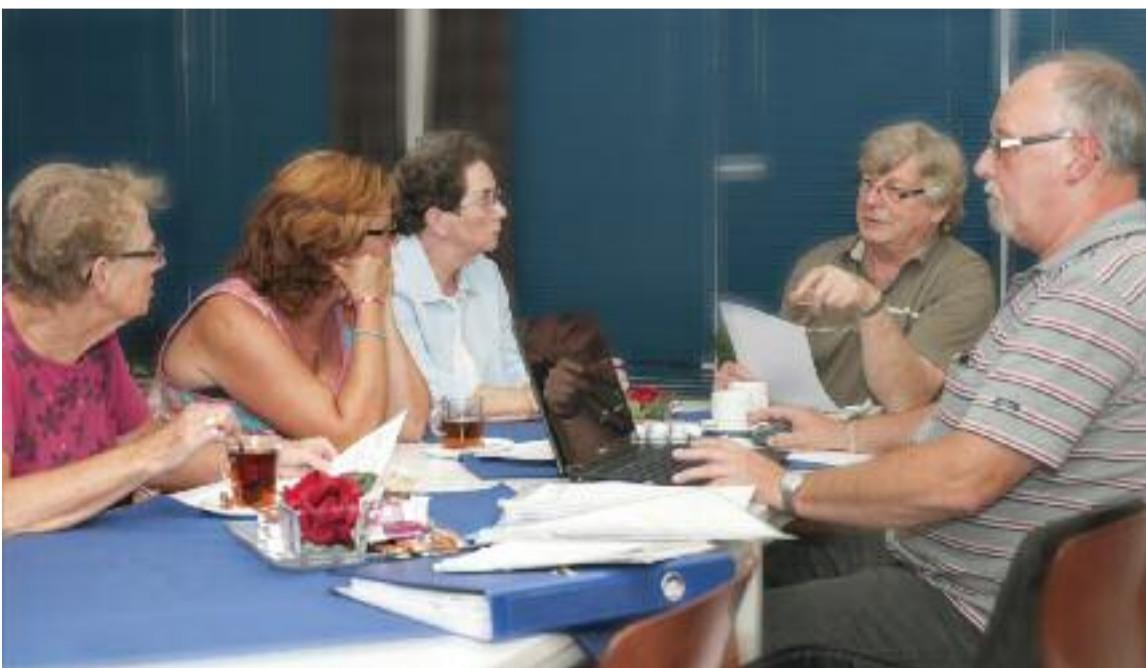
Iedere eerste dinsdag van de maand heeft huurdersvereniging AHG spreekuur in De Schommel, de speeltuinvereniging in Molenaarsgraaf.

'De verschillende overlegorganen die er nu zijn zouden ook meer kunnen gaan samenwerken. Zo is er een klankbordgroep van de gemeente. Hier wordt eveneens gesproken over wonen en de woonomgeving. Misschien is het zinvol om een en ander te koppelen. We hebben bijvoorbeeld al een aantal keer overleg gehad met huurdersvereniging H3S in Sliedrecht. Het is toch geweldig als je van elkaars kennis gebruik kan maken.'